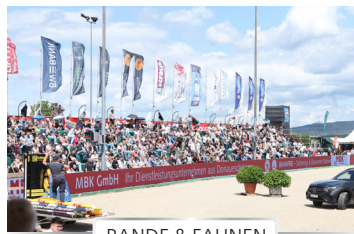
BANDE & FAHNEN

In unserer Ausstellung können Sie mit potenziellen Kunden persönlichen Kontakt aufnehmen und Ihre Produkte ausstellen oder direkt verkaufen.