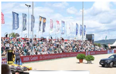
BANDE & FAHNEN

In unserer Ausstellung können Sie mit potenziellen Kunden persönlichen Kontakt aufnehmen und Ihre Produkte ausstellen oder direkt verkaufen.